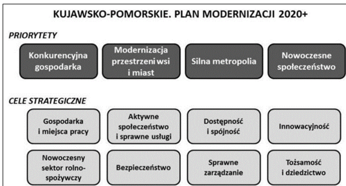
Rysunek 1. Priorytety i cele strategiczne województwa kujawsko – pomorskiego