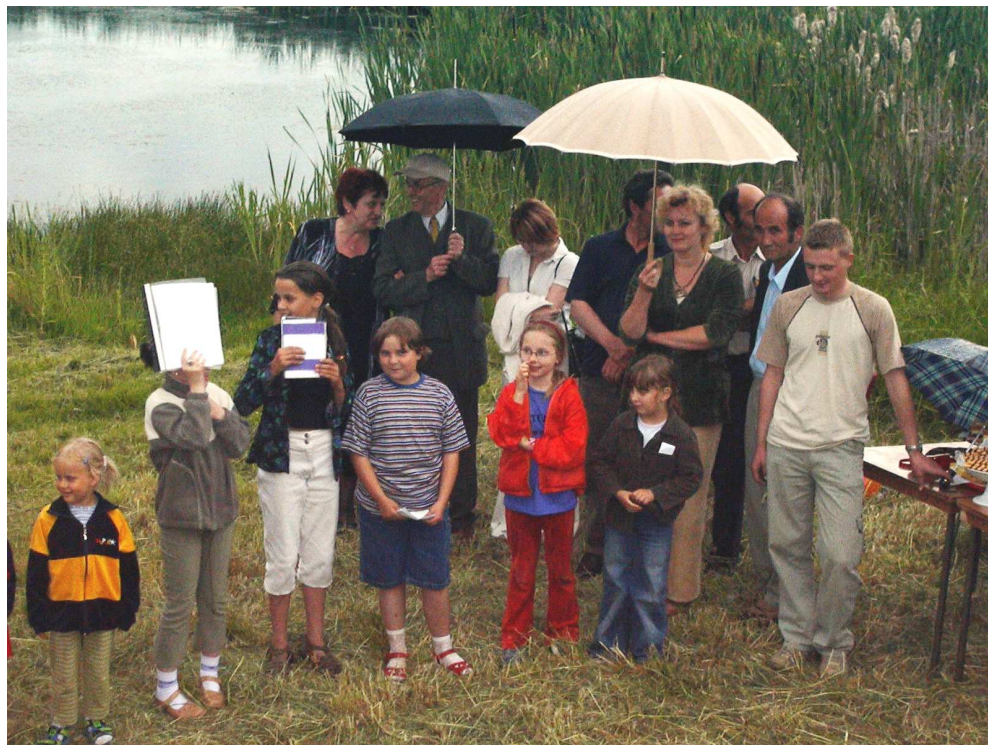
Noc świętojańska 2004 r. Czołowo