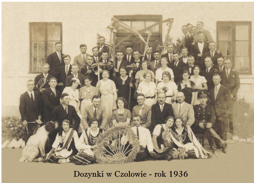
Dozynki w Czolowie - rok 1936