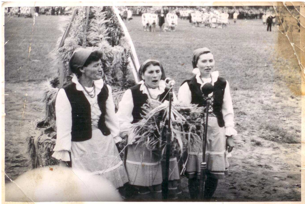
Dożynki w Radziejowie 1970 rok. Delegacja z Czołowa