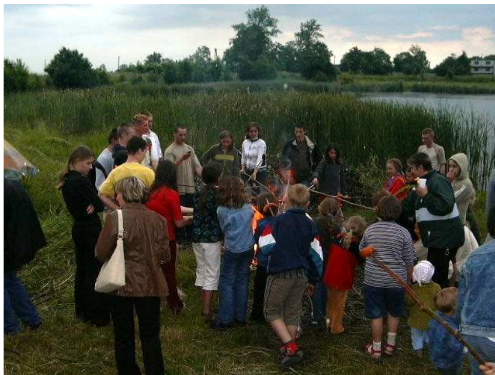
Noc świętojańska 2004 r. Czołowo