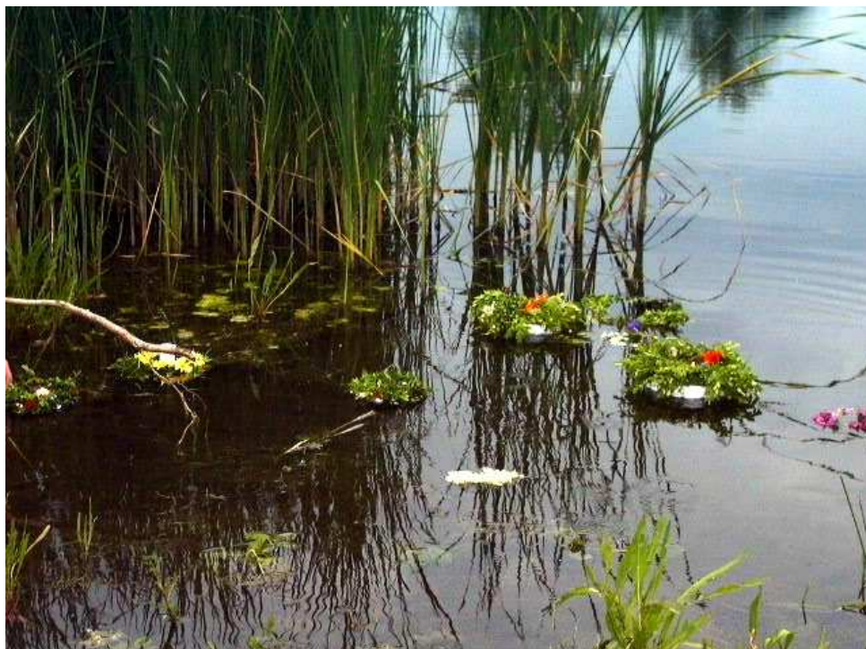
Noc świętojańska 2004 r. Czołowo