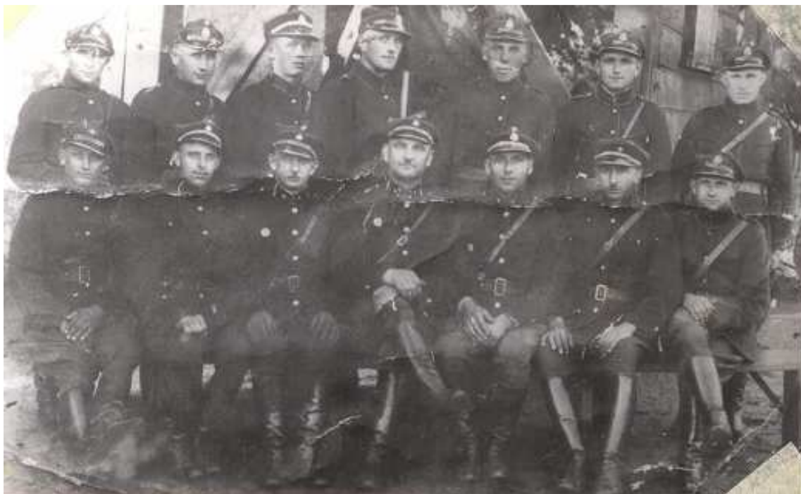
Drużyna Ochotniczej Straży Pożarnej z Szostki, z przed 1939 roku