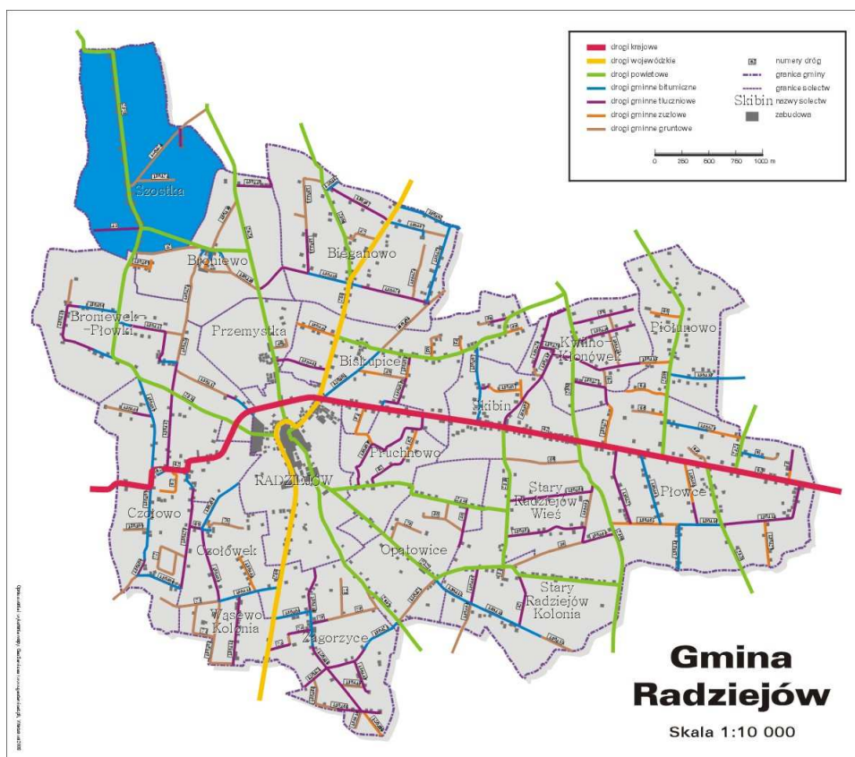
Mapa Gminy Radziejów z zaznaczonym położeniem Szostki

Szostka leży w województwie kujawsko - pomorskim, w powiecie radziejowskim, na terenie gminy Radziejów. Jest oddalona o około 6 km na północny zachód od Radziejowa. W latach 1975 - 1998 wieś administracyjnie należała do województwa włocławskiego. Miejscowość zajmuje powierzchnię 7,43 km 2 , zamieszkuje ją aktualnie 200 osób.