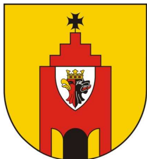
Herb gminy Radziejów