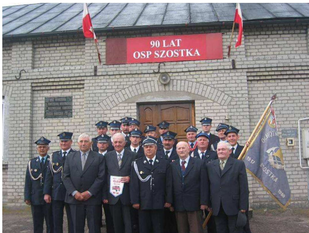
90- lecie Ochotniczej Straży Pożarnej w Szostce - 6 maja 2007 roku