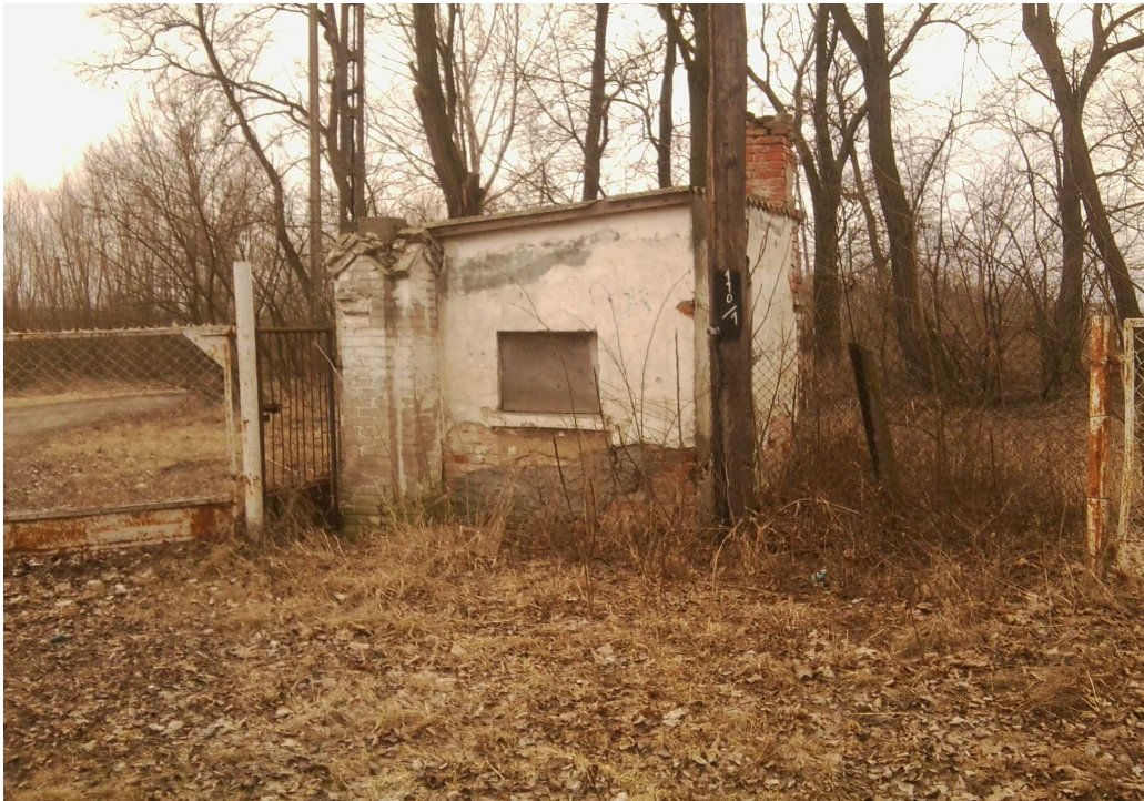
stróżówka z 1933 roku