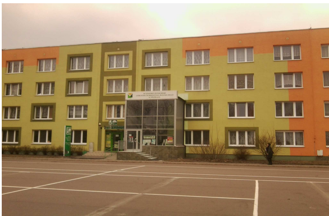
Internat szkoły, w którym m.in.