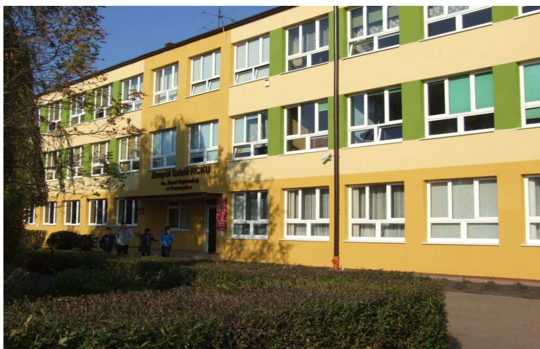
Zespół Szkół Centrum Kształcenia Ustawicznego im. Ziemi Kujawskiej w Przemystce