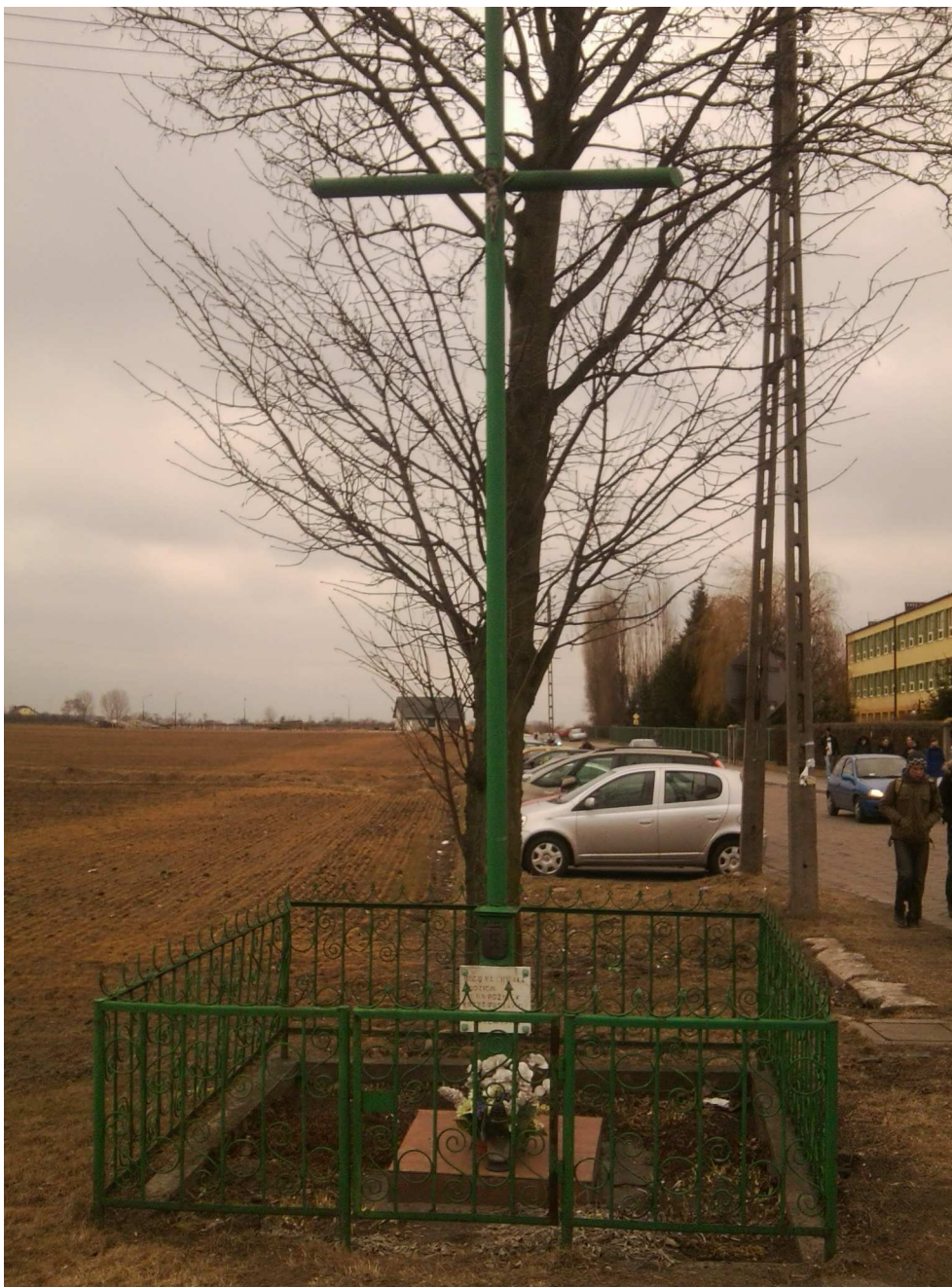
przydrożny krzyż z okresu międzywojennego