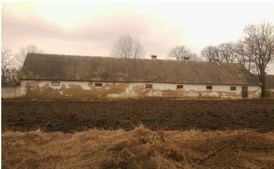
dworska stajnia koni z okresu przedwojennego