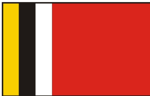
Flaga gminy Radziejów