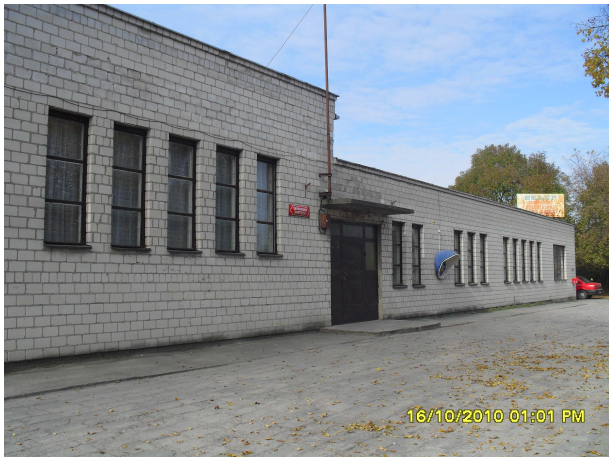
Świetlica w Bieganowie